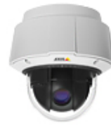
S O6032-E S O6034-E