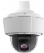
S P5532-E S P5534-E