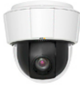
S P5532 S P5534