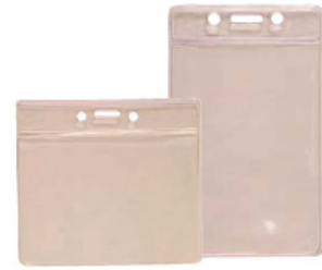
vinilo blando 98 x 67mm