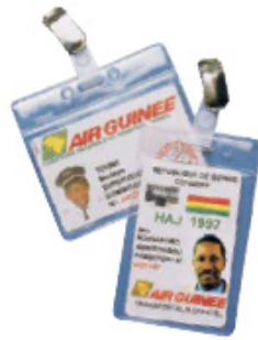
vinilo blando estándar con pinza metal