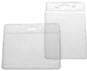
Porta-tarjetas vinilo blando estándar con banda reforzada