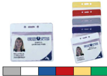
vinilo blando con banda de color