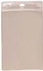
vinilo blando vertical