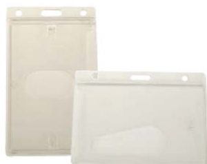
policarbonato rígido mate