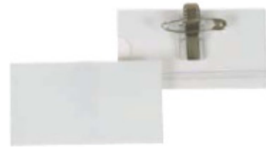
Acreditación conferencia con pinza tipo cocodrilo e impermeable