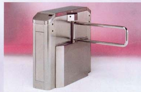
Panel batiente Moving panel