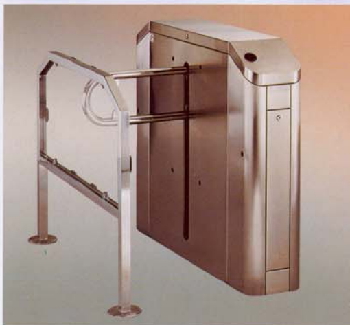
Panel abatible y ocultable Folding and hidden panel