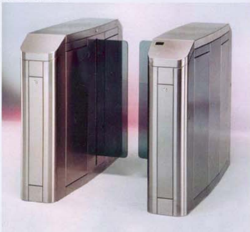
Paneles correderos ocultables Sliding and hidden panels