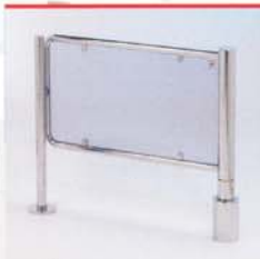
PM-400 PM-401 PM-402 PM-403